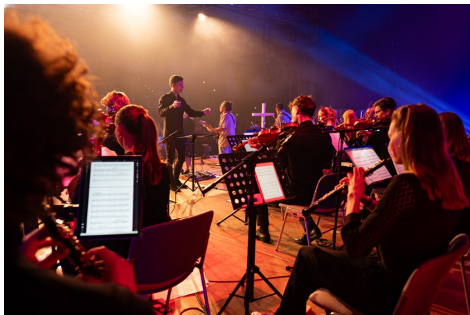
Gemeinschaft Immanuel, LobpreisKonzert

Der am Ostermontag verstorbene Papst Franziskus hat diesen Aspekt neben der Taufe im Heiligen Geist und dem Dienst an den Armen auch für die charismatische Erneuerung als drittes Hauptanliegen der Erneuerung genannt und darauf hingewiesen, dass gerade die charismatische Erneuerung hier einen Beitrag leisten kann. In einer Botschaft an CHARIS (2019) schreibt er: „Ich habe CHARIS ins Leben gerufen, um der gesamten charismatischen Erneuerung einen Dienst der Einheit und Gemeinschaft zur Verfügung zu stellen. Und dieser Dienst ist untrennbar mit der Ökumene verbunden.“ In seiner Ansprache bei der Eröffnung von CHARIS (2019) sagt er: „Einer der spezifischen Aufträge von CHARIS ist der Dienst an der Einheit der Christen. Die charismatische Erneuerung hat eine besondere Gnade erhalten, Brücken zwischen den verschiedenen christlichen Konfessionen zu bauen.“ Und in einer Rede im Jahr 2015 hören wir: „Die beste Form der Ökumene ist das gemeinsame Gebet und das gemeinsame Wirken im Dienst der Armen und Leidenden.“